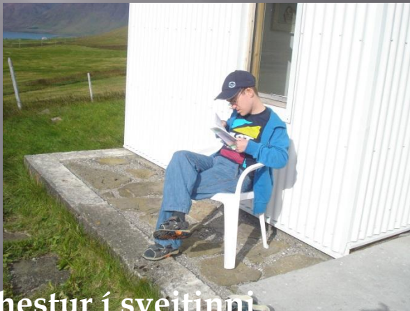
Lestrarhestur í sveitinni