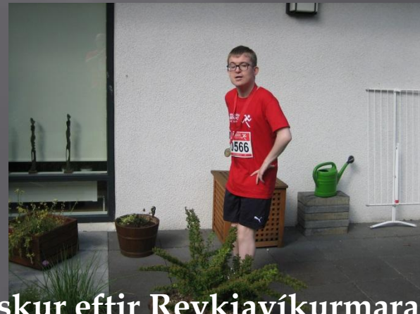
Ferskur eftir Reykjavíkumaraþon