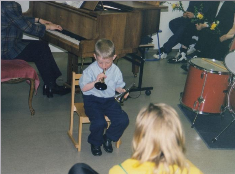
Byrjaði ungur að spila og syngja á tónleikum