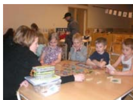
Atvinna: Sérkennari / stuðningsfulltrúi